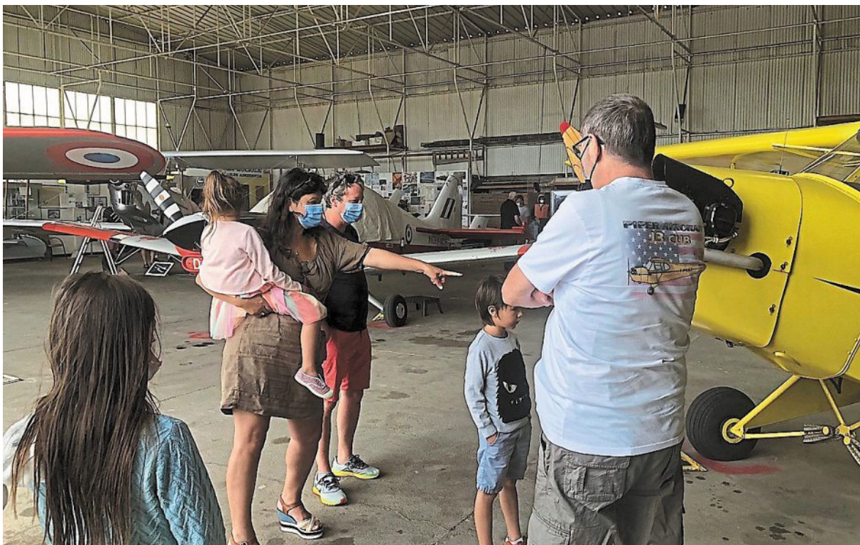
L'association Mapica restaure et expose des avions anciens depuis 1980.

L'épave a nécessité, entre 1980 et 1985, plusieurs milliers d'heures