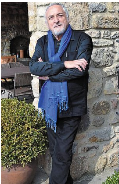
Jean Moiras exposera ses dernières œuvres à l'espace Rex.

Jusqu'au dimanche 29 août , ouvert tous les jours, de 11 h à 13 h et de 15 h à 19 h. Nocturne samedi